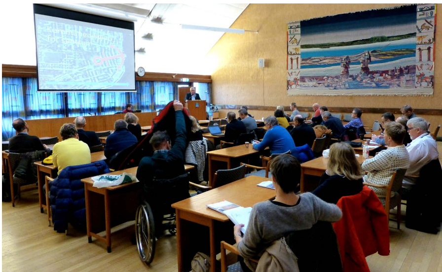
Torsdag 4. februar var Plan og bygningsrådet samt hovedutvalg for miljø og tekniske tjenester samlet til fellesmøte for å drøfte innholdet i planforslaget

henger. Denne arbeidsfasen går nå mot slutten, og det skal utarbeides forslag til plankart med bestemmelser. Dette forslaget vil bli lagt ut på høring.