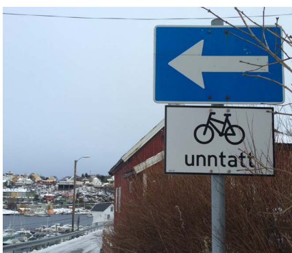
Skiltet viser kjørende, syklende og gående at sykling mot kjøretretning er tillatt.

Vi har nå satt opp skilt på flere strekninger som gjør det lovlig å sykle mot enveiskjørt gater. På Kirkelandet er det lov å sykle mot enveiskjøring i P. Rosentræders gt. og Schou Bruuns gt. På Goma kan de sykles mot enveiskjøring i Stortuveien og i Freiveien. Åtte gater gjenstår å skilte før det kan sykles mot alle enveisregulerte veier og gater i kommunen.