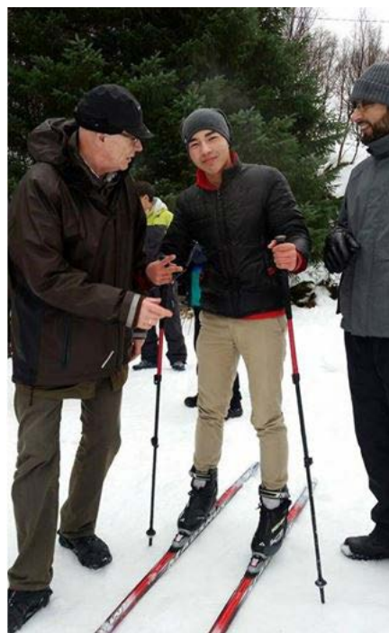
Øverst til venstre kirkekaffe i romjula. Til venstre fra gave-lageret i Folkets hus. Over glimt fra turdag i Folkeparken.