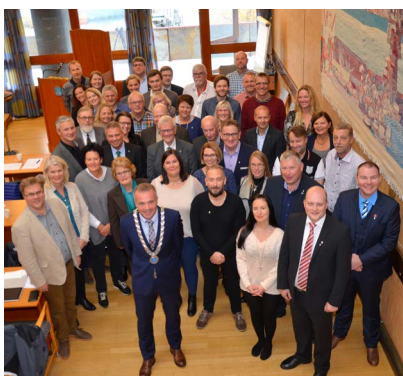
Bilde fra bystyrets konstitueringsmøte 13. oktober 2015