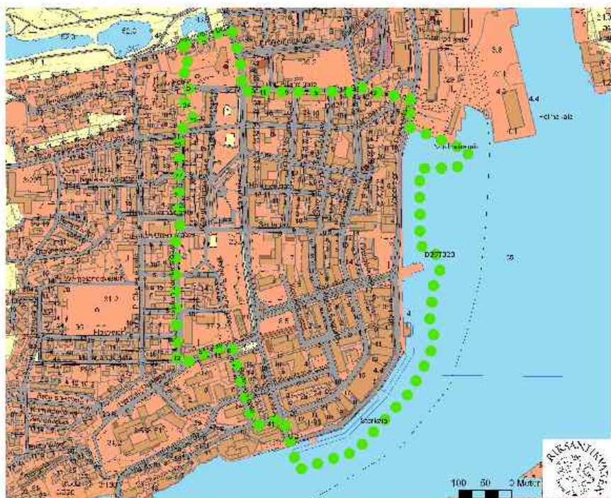
Kristiansund delområde Sentrum