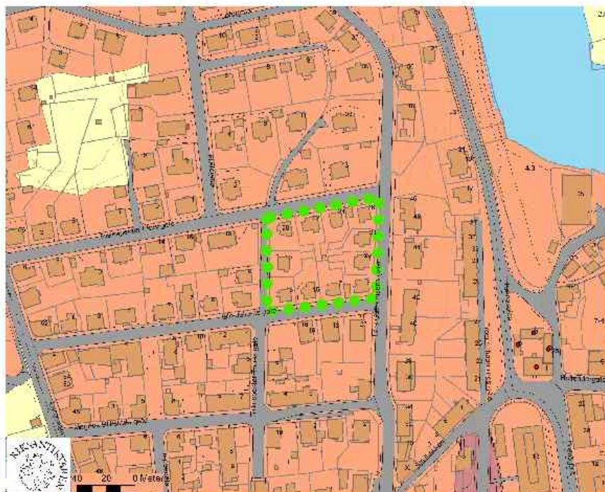
Kristiansund delområde Moskvahaugen