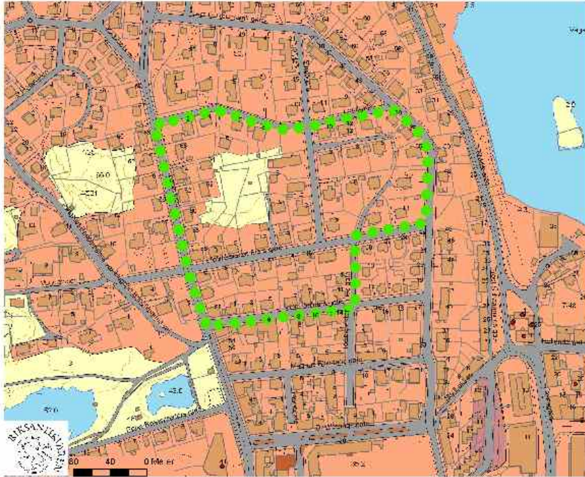
Kristiansund delområde Plysbyen