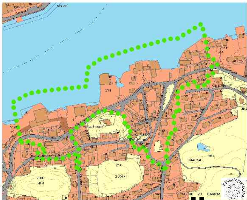
Kristiansund delområde Innlandet