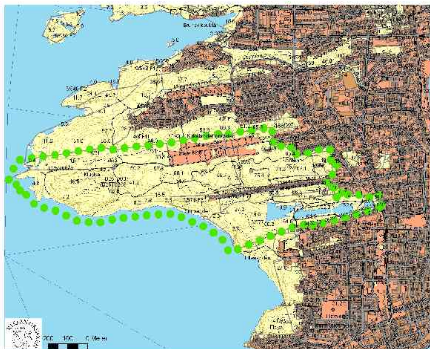
Kristiansund delområde Kirkelandet