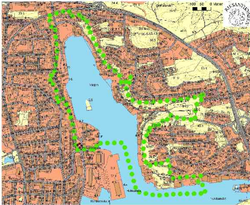
Kristiansund delområde Vågen