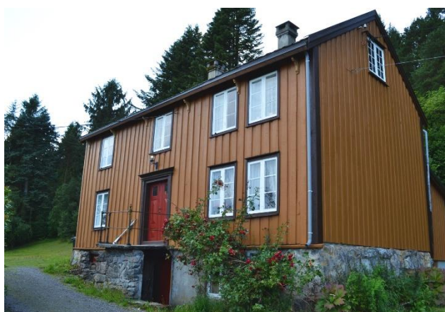
Viken gard, foto: Kristiansund kommune.

With beholdt Indre Vika da han solgte garden i 1880. Det var han som bygde de husa som nå er i Vika. Der drev han også landhandel og sagbruk en tid. Vektlodda og protokollen hans er fremdeles å finne på garden, og stolen hans står i stua. Han hadde orgel i sørstua.