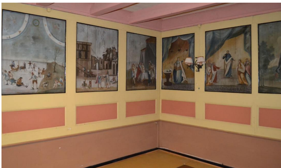
Interiør med veggmalerier på Dalen gård.

I Våningshuset i Dalen gård finnes noen meget interessante malerier. I andre etasje er storsalens vegger dekket av malerier. Motivene er gammeltestamentariske samt astro-matematiske, med norsk eller engelsk tekst under. Milns hus med maleriene må ha vært arnested for en egenartet religiøs etisk kultur. Kanskje frimureri? Hvem maleren/malerne var er uvisst. Trolig fikk W. Miln bildene malt i 1770-90.