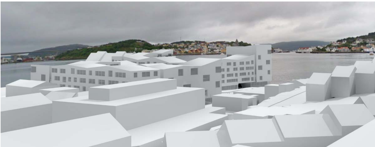
Illustrasjon viser ny bebyggelse sett fra gjenreisningsbyen, ved Stallbakken/L. Guttormsens gt.