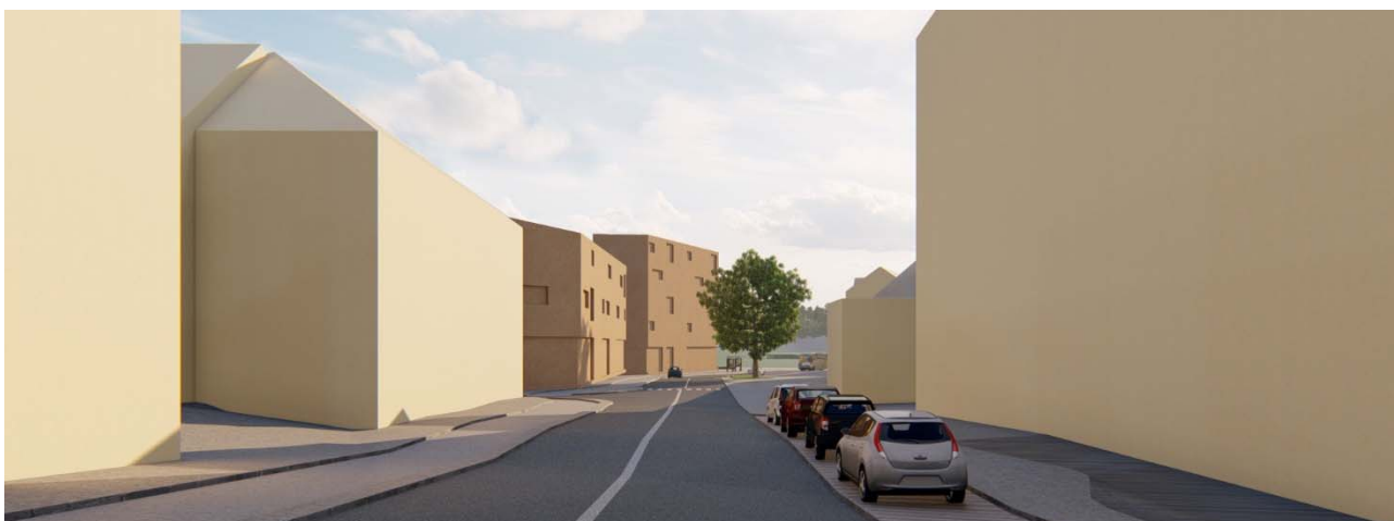
Illustrasjon viser ny bebyggelse sett langs Fosnagata fra nord mot sør.