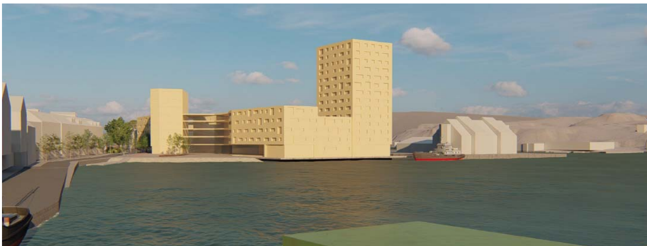
Illustrasjon viser ny bebyggelse sett fra Klippfiskkjerringa ved Rådhusplassen.

Variant c. har høyhus opp i 14 etasjer i sør. Kjernebebyggelsen er jevnt over 5 etasjer, unntatt et hjørnebygg i 7 etasjer som markerer og definerer fondveggen på torget og hjørnet mot Fosnagata.