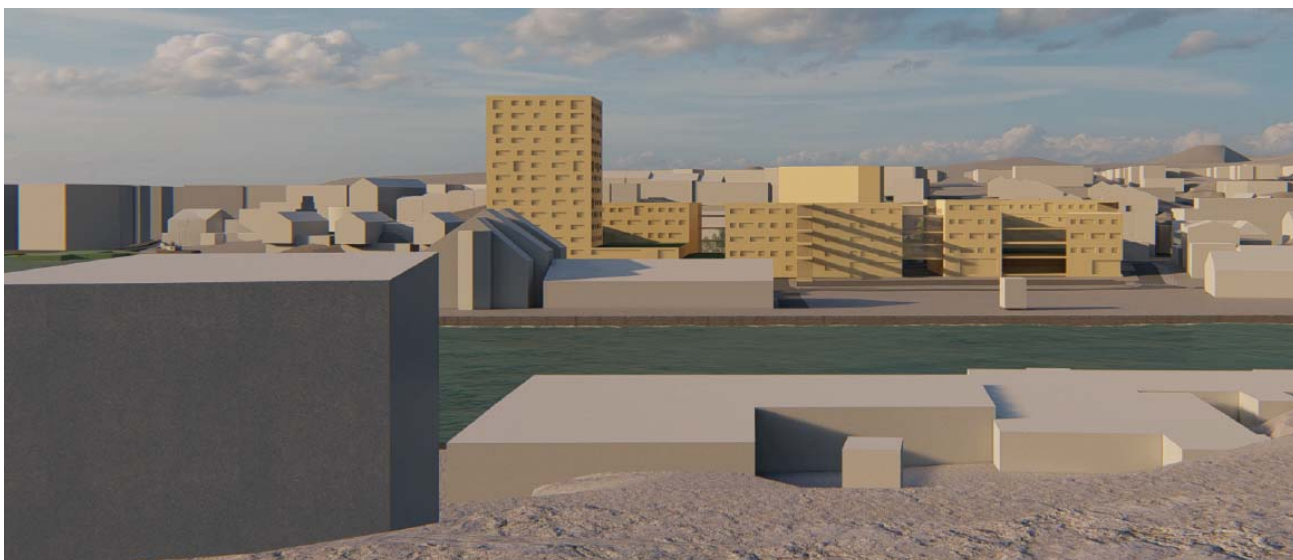
Illustrasjon viser ny bebyggelse sett fra Klippfiskmuseet på Israelsneset, Gomalandet.