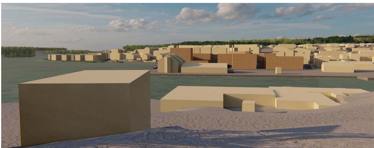
Illustrasjon viser ny bebyggelse sett fra Klippfiskmuseet på Israelsneset, Gomalandet.