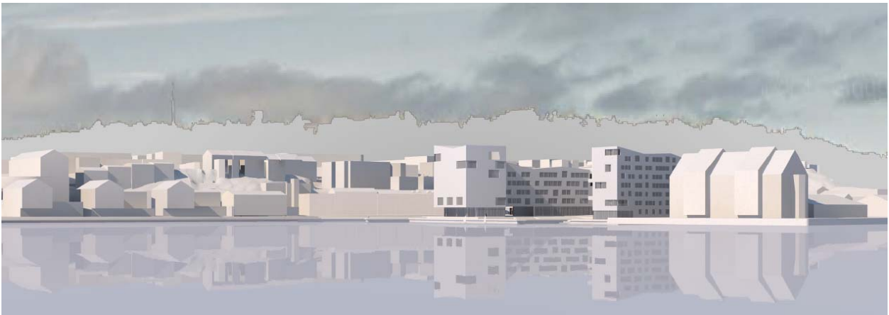
Illustrasjon viser ny bebyggelse sett fra Hamna / Sundbåtkaia ved Nordlandet

Variant a. tilsvarer parallelloppdraget for Devoldholmen fra 2017. Her er det vist ny bebyggelse med varierende høyder fra 4 etasjer til 7 etasjer, der bebyggelsen langs Fosnagata er 5 etasjer og er trukket opp i 7 etasjer som punktbebyggelse helt i sør.