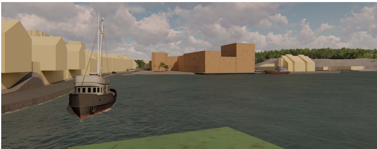
Illustrasjon viser ny bebyggelse sett fra Klippfiskkjerringa ved Rådhusplassen.

Variant b. er et minimumsalternativ med lavere tomteutnyttelse og færre kvadratmeter gulvareal enn de andre alternativene. Her er det vist ny bebyggelse med varierende høyder fra 3 etasjer til 6 etasjer, der bebyggelsen langs Fosnagata er i 3 og 5 etasjer og et volum i sør er vist i 6 etasjer.