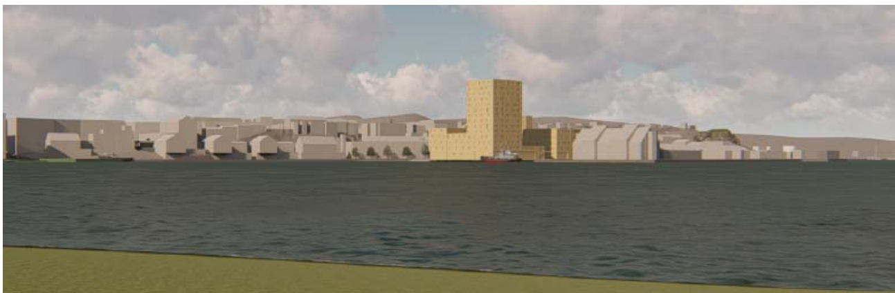
Illustrasjon viser ny bebyggelse sett fra Hamna / Sundbåtkaia ved Nordlandet