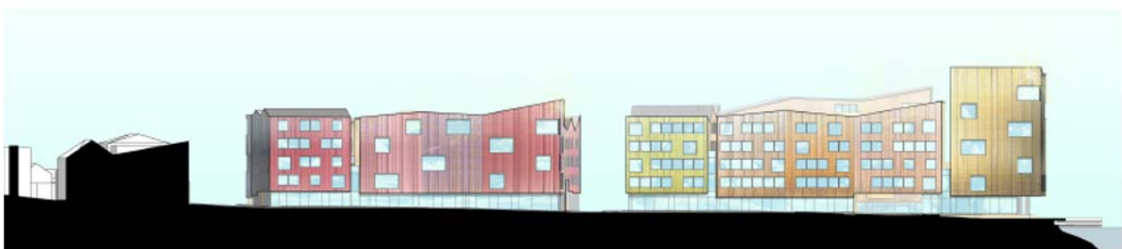
Oppriss av bebyggelse i parallelloppdraget, med sørfasaden sett fra Hamna, og vestfasaden sett fra Fosnagata.