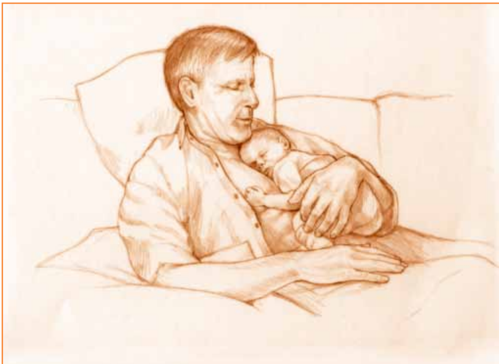
Barnet trenger trygghet og kjærlighet – ligger hud-mot-hud hos mor eller far

Særlig de første ukene har spedbarnet behov for å tilbringe mye av sin tid i foreldrenes armer. Det trenger kroppsvarmen og nærheten deres, slik at overgangen fra tiden inne i morens mage blir så skånsom som mulig. Du selv trenger også omsorg og ro. Skru ned tempoet, og still gjerne lavere krav til både husarbeid og sosialt liv. En trett og anstrengt mor og mas fra omgivelsene kan gjøre både deg og barnet urolige og utilfredse. Ammestundene bør, særlig den første tiden, være hvilepauser for deg også – en mulighet til å legge seg nedpå med god samvittighet. Barnet trenger trygghet og kjærlighet – ligger hud-mot-hud hos foreldrene.