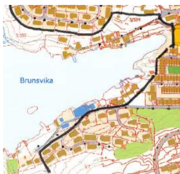
Gjeldande byggegrense sjø

Det er foreslått byggegrense ved gbnr. 3/493, 494 og 481. Byggegrensa er foreslått nært eit registrert svært viktig friluftsområde som er omtala som leike- og rekreasjonsområde, jf. Naturbase. Vi saknar ei vurdering av om tiltak på eigedomane kan ha innverknad på friluftslivinteressene (stiar mm.), samt om tiltak på desse eigedomane vil kunne ha innverknad på landskapet sidan dei ligg i høgda med utsyn mot sjøen. Vi rår kommunen til å gjere slik vurdering.