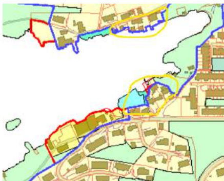
Forslag ved tredje høring