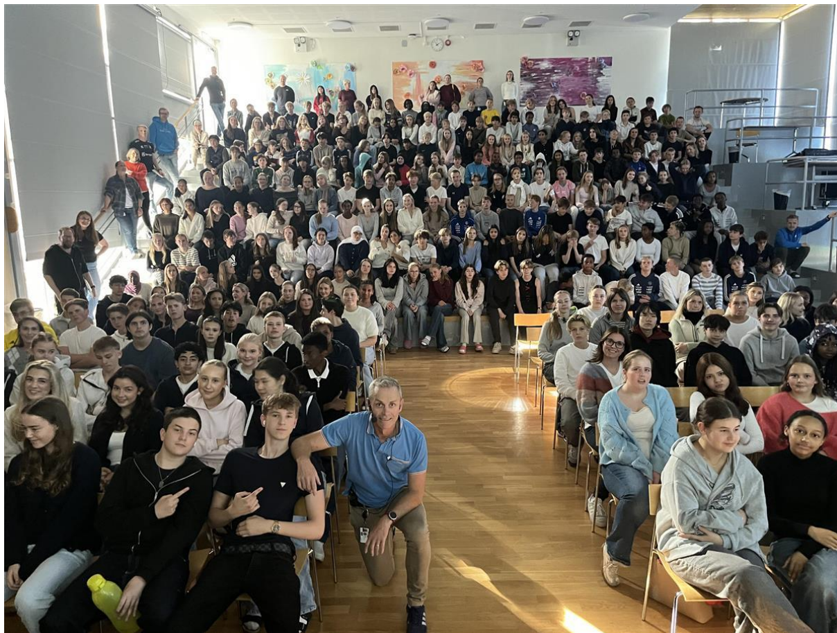
Atlanten ungdomsskole 20 år TK