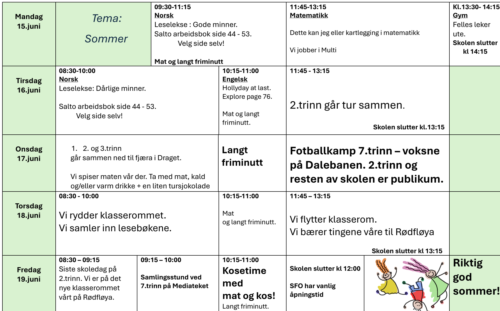
Figur 1 Strektegninger av barn